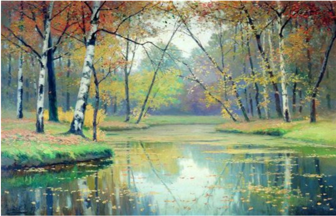
В. Волков "Осень"