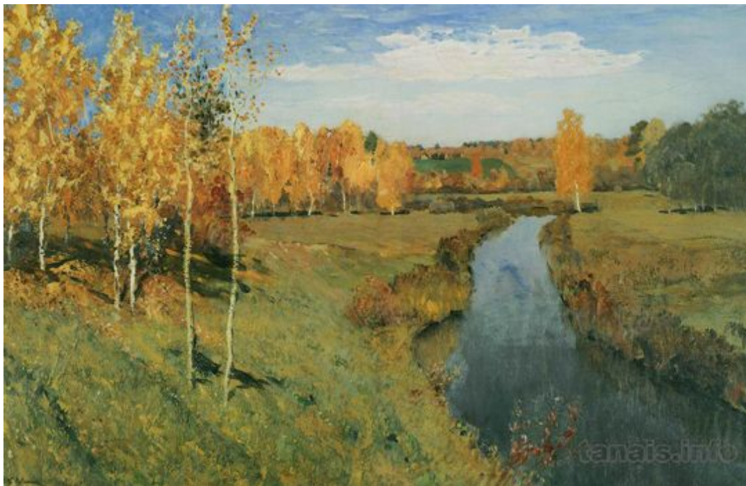
И. Левитан "Золотая осень"