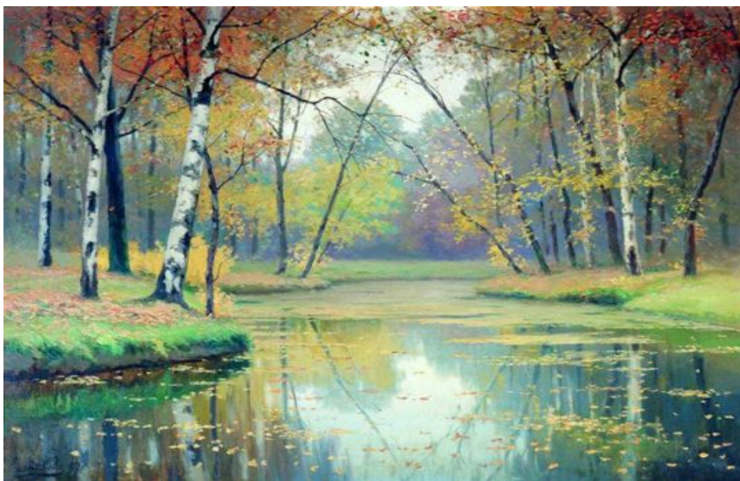
В. Волков "Осень"