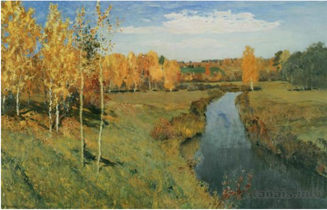
И. Левитан "Золотая осень"